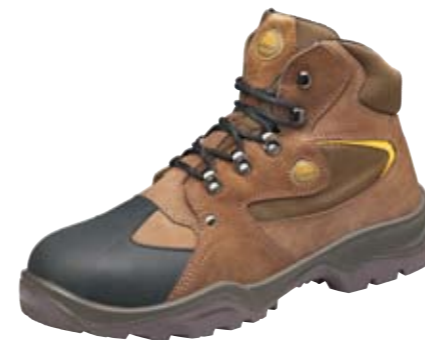
RAN | S1 P