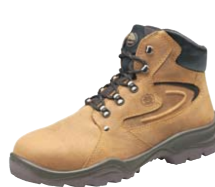
NICOR | S3