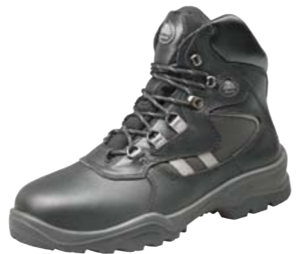
GUNN | S1 P