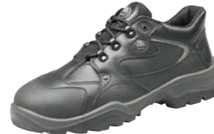
HERVOR | S3