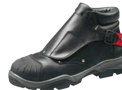
RADO | S3

Výhody podrážky z polyuretánu (PU) a z gumy modelu Rado z kolekcie Spirit® sú viditeľné najmä v situáciách, kde je vyžadovaná extrémne vysoká odolnosť proti pošmyknutiu. Vonkajšia podrážka z gumy je výnimočne trvácna a je odolná voči olejom, kyselinám a prerezaniu. Izoluje zimu a je teplu odolná až do 300 °C. Odpruženie a komfort sú zabezpečované ľahkým a flexibilným polyuretánovým PU stredom podrážky.