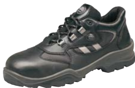
ASAR | S1 P