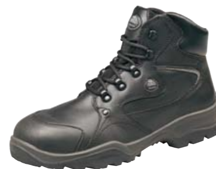
SKADI | S3