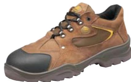
ODIN | S1 P

Podrážka PU/TPU na obuvi Spirit® poskytuje príľnavosť k pracovnej podlahe aj v prípade nečakaných pohybov. Stred podrážky je vyrobený z ohybného polyuretánu (PU), ktorý poskytuje zvýšenú absorpciu. Vonkajšia podrážka je protišmyková vo všetkých smeroch vďaka použitiu termoplastického polyuretánu (TPU). Extrémne trvácny materiál, ktorý je tiež použitý na vonkajšiu špicu.