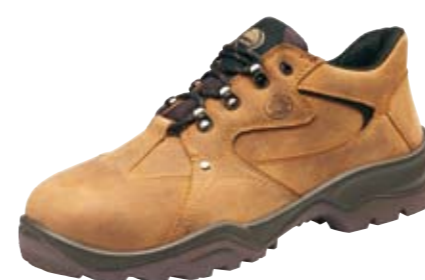
FREY | S3