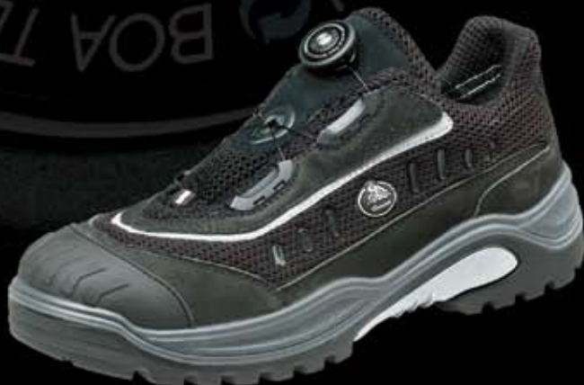
Traxx 213/S1 P