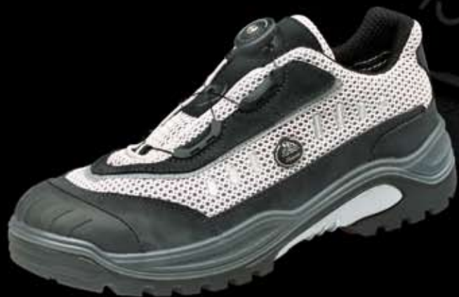
Traxx 212/S1 P