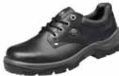
SENECA | S2