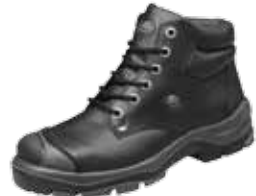
APACHE | S2