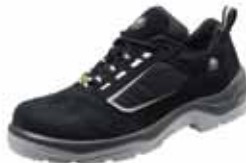
SAXA ESD | S2