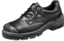
MAYA | S3