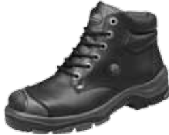
MALENKA | S3