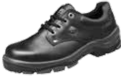
PONTO | S3