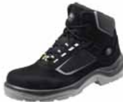
YORA ESD | S2