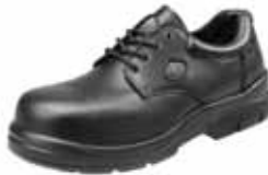
CALUSA | S3