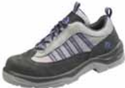
MOHAVE | S1