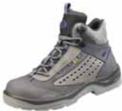
NAVAHO ESD | S1