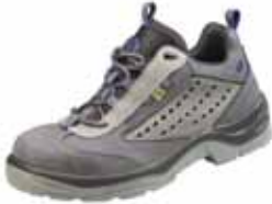
COMANCHE ESD | S1

Diese Schuhmodelle sind durch eine Baumusterprüfung des PFI, Pirmasens für Sohlen- und Absatzerhöhungen bis 3,0 cm zugelassen.