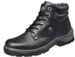
HURON | S2