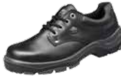
INCA | S2