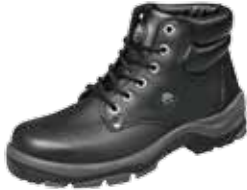
OMAHA | S3