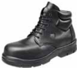
PUEBLO | S3

Bata Industrials hat mit fachlicher Unterstützung der IETEC seine internationalen Verbindungen genutzt, um besonders für Diabetiker und Rheumatiker spezielle Schuhmodelle zu entwickeln (Modelle Pueblo/Calusa). Dies ermöglicht jetzt den Einbau von notwendigen, hochdämpfenden und formgebenden Materialien. Dadurch konnten Kosten ganz erheblich reduziert werden.