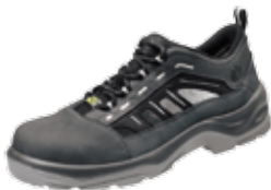
TIGUA ESD | S1